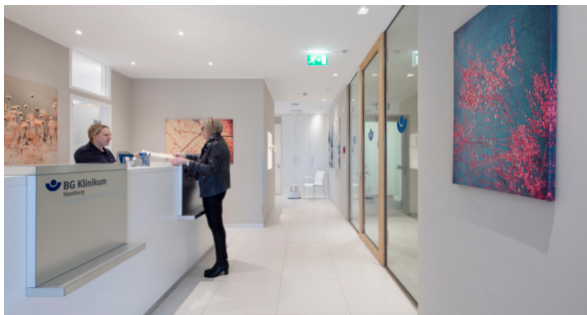
UKM-BGAOP-F-018 / V. 1.0 vom 02.02.23

Falkenried 88 · 20251 Hamburg Im CiM · Haus C · 4. Stock Tel. 040 80 80 68 8-0 Fax 040 80 80 68 8-88 bgaop@bgk-hamburg.de www.bgaop.de