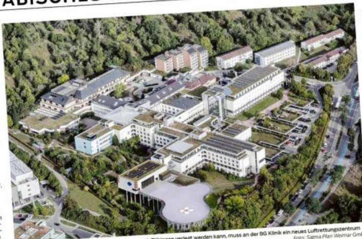
Damit „Christoph 41“ zu Ende 2027 von Leonberg nach Tübingen verlegt werden kann, muss an der BG Klinik ein neues Luftrettungszentrum gebaut werden (auf dem Bild unten Mitte).