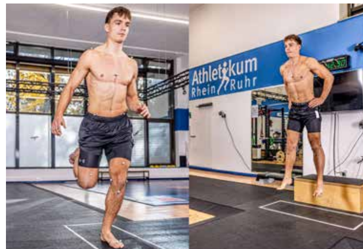
Lauf- und Sprunganalyse