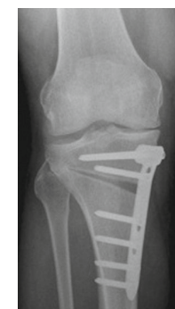
Umstellungsosteotomie am Kniegelenk