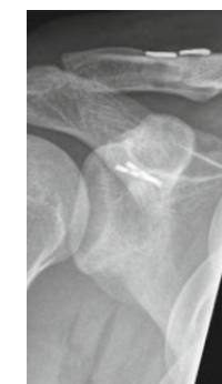
minimalinvasive Schulterreckgelenk- rekonstruktion