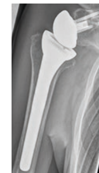
Minimalinverse - Schultertotalendoprothese